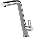
Mischbatterie KE 8492 000