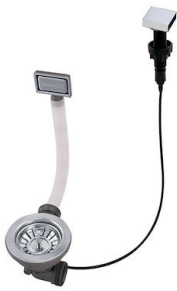
Automatischer Abfluss 8407 113